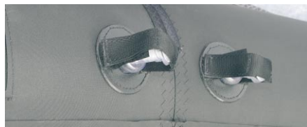
Die Ventile sitzen auf einem Verstärkungskranz. Die Verarbeitung wirkt sehr solide.

man den Kite früh in seine Flugposition stellen kann (ohne Kurven fliegen zu müssen), weil er früh Kraft entwickelt. Dafür sind ihm nach oben Grenzen gesetzt. Der Relaunch funktioniert für einen Hochleister