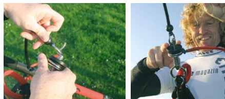
Beste Ingenieurskunst am Metall-Quickrelease. Man zieht mit zwei Fingern nach hinten.